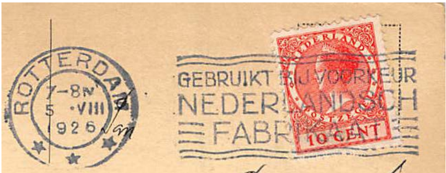
afb. 1 Nederlandsch Fabrikaat

In dit tweede deel wil ik het begrip wereld tentoonstelling kort toelichten en zal ik proberen antwoord te geven op de vraag of Nenijto eigenlijk wel een wereld tentoonstelling was?