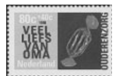
Nederland zomerzegels ouderenzorg 1998 NVPH nrs. 1757/59