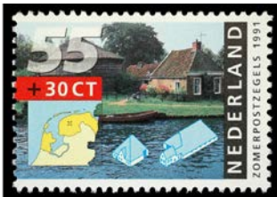
Afbeelding van Friese boerderij (geen stolp)

Bij mijn voorbereiding van een nieuw artikel over de zorg voor ouderen in de regio Zaanstreek zoek ik hulp. Is er onder u een verzamelaar die zich bezighoudt met filatelie op het gebied van zorg (voor ouderen) en die mij wil helpen aan informatie? Ik zoek niet alleen inhoudelijke informatie maar vooral ook interessante poststukken en ander filatelistisch materiaal die het verhaal kunnen ondersteunen. De werktitel wordt: “Van bejaardenhuis naar kangoeroewoning in de Zaanstreek”.