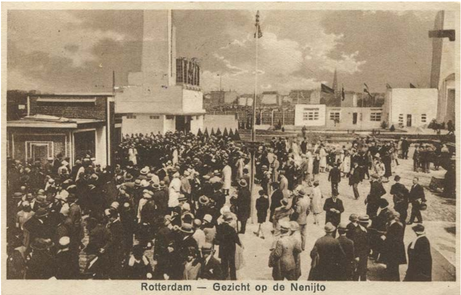
Afb. 4 Drukke bij de hoofdingang

Om de tentoonstelling extra aantrekkelijk te maken voor bezoekers was er een heuse kermis met achtbaan, een restaurant, werden er allerlei nevenactiviteiten georganiseerd en met succes. Ook werd door de PTT nog lang reclame gemaakt voor de tentoonstelling getuige deze kaart met stempel 8 september 1928. Sluiting zou half september plaatsvinden maar werd zoals eerder gezegd met twee weken uitgesteld. De toeloop was